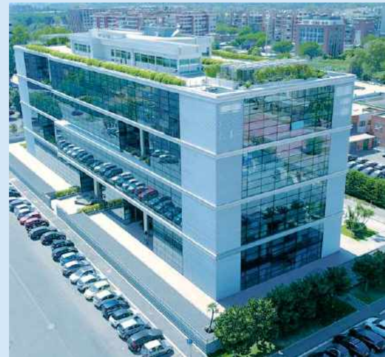
Headquarter di Roma - Via Amsterdam, 125