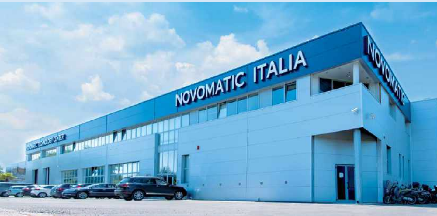
Sede operativa di Rimini - Via Galla Placidia, 2